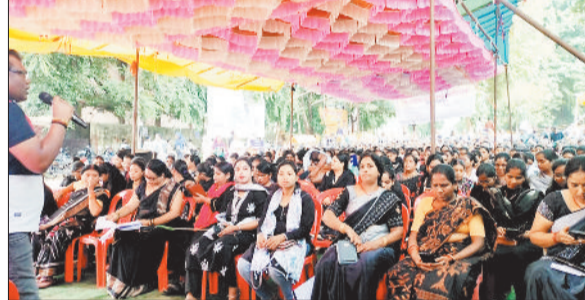
धरना स्थल पर काला पोशाक पहनकर पहुंचे एनएचएम कर्मी।