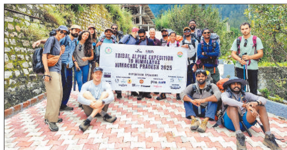
हिमालय की ओर रवाना जनजातीय पर्वतारोहण टीम।

अपराधियों पर कड़ी कार्रवाई है: वरिष्ठ पुलिस अधीक्षक शशि मोहन सिंह ने बताया कि कोतबा क्षेत्रांतर्गत कूटरचना कर वाहनों का फाइनेंस कराते और उन्हें बेचने वाले गिरोह के पांच आरोपी जेल भेजे जा चुके हैं। पुलिस ने अब तक 10 बुलेट व एक स्कूटी बरामद की है। इस तरह के अपराधियों पर जशपुर पुलिस लगातार कड़ी कार्रवाई कर रही है।