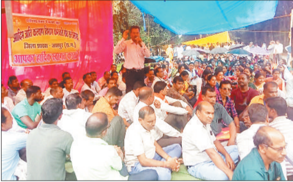
धरना प्रदर्शन करते कर्मचारी।

जशपुरनगर। आदिवासी विकास विभाग के अधीन संचालित विभागीय छात्रावास एवं आश्रमों में कार्यरत चतुर्थ श्रेणी एवं दैनिक वेतनभोगी कर्मचारियों ने आखिरकार सोमवार से अनिश्चितकालीन हड़ताल का बिगुल बजा दिया। लंबे समय से शासन-प्रशासन के दरवाजे खटखटाने के बावजूद जब उनकी जायज मांगों पर कोई ठोस कार्यवाही नहीं हुई, तो सैकड़ों कर्मचारी एकजुट होकर कामकाज ठप कर आंदोलन पर बैठ गए। कर्मचारियों ने कलेक्टर को सौंपे गए ज्ञापन में स्पष्ट किया था कि वर्ष 1996 और 1999 के शासनादेशों तथा 2012 के विभागीय निर्देशों के तहत कलेक्टर दर और दैनिक वेतनभोगियों को नियमितकरण का लाभ मिलना चाहिए।