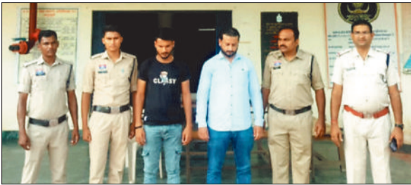
पुलिस गिरफ्तार में आरोपी।

पुलिस ने एक बार फिर यह साबित कर दिया है कि अपराध चाहे कितना भी शांतिराना क्यों न हो उसके तार कितने ही उलझे क्यों न हों कानून की पकड़ से बच पाना नामुमकिन है। कूटरचना कर फाइनेंस कंपनियों को ठगने वाले शांतिराने के दो और फरार सदस्य पुलिस के हथे चढ़ गए हैं। इनकी गिरफ्तारी के साथ ही अब तक पांच आरोपी सलाखों के पीछे पहुंच चुके हैं। पुलिस ने पहले ही 10 बुलेट और एक स्कूटी जब्त कर मामले में बड़ा खुलासा किया था।