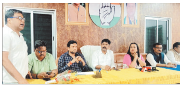
प्रेसवार्ता करते कांग्रेसी।

बदल गई। ढोल-नगाड़ों की थाप पर नाचते-गाते श्रद्धालु अचानक तेज रफ्तार भरोदो वाहन की चपेट में आ गए। भागदौड़ और चीख-पुकार के बीच सड़क पर लाशें और घायल तड़पते रहे। इस दर्दनाक हादसे में तीन लोगों की मौत और 22 श्रद्धालु गंभीर रूप से घायल हुए। घटना के बाद पीड़ित परिवारों ने सड़क पर ही राह रखकर न्याय और उचित मुआवजे की मांग की। लेकिन प्रशासनिक अमला घंटों तक मौके पर नदारद रहा। कांग्रेस नेताओं ने इसे प्रशासन की "संवेदनहीनता और जनविरोधी नीति" करार